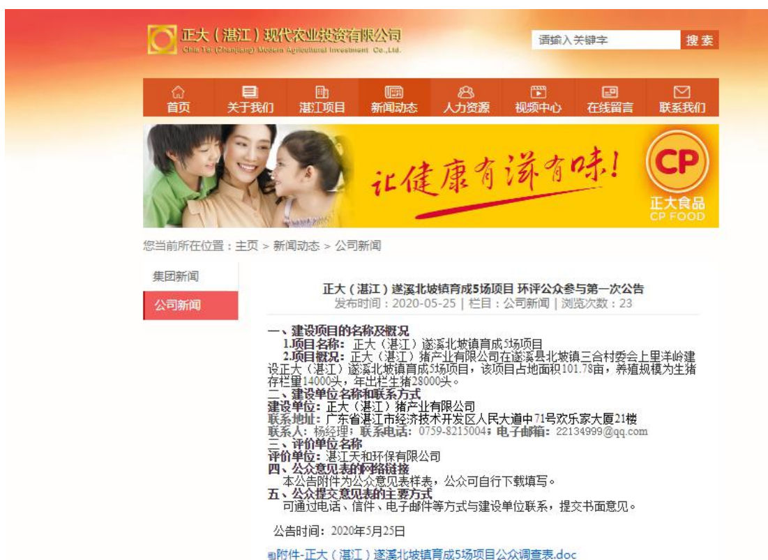
图 1 第一次网上公示网页