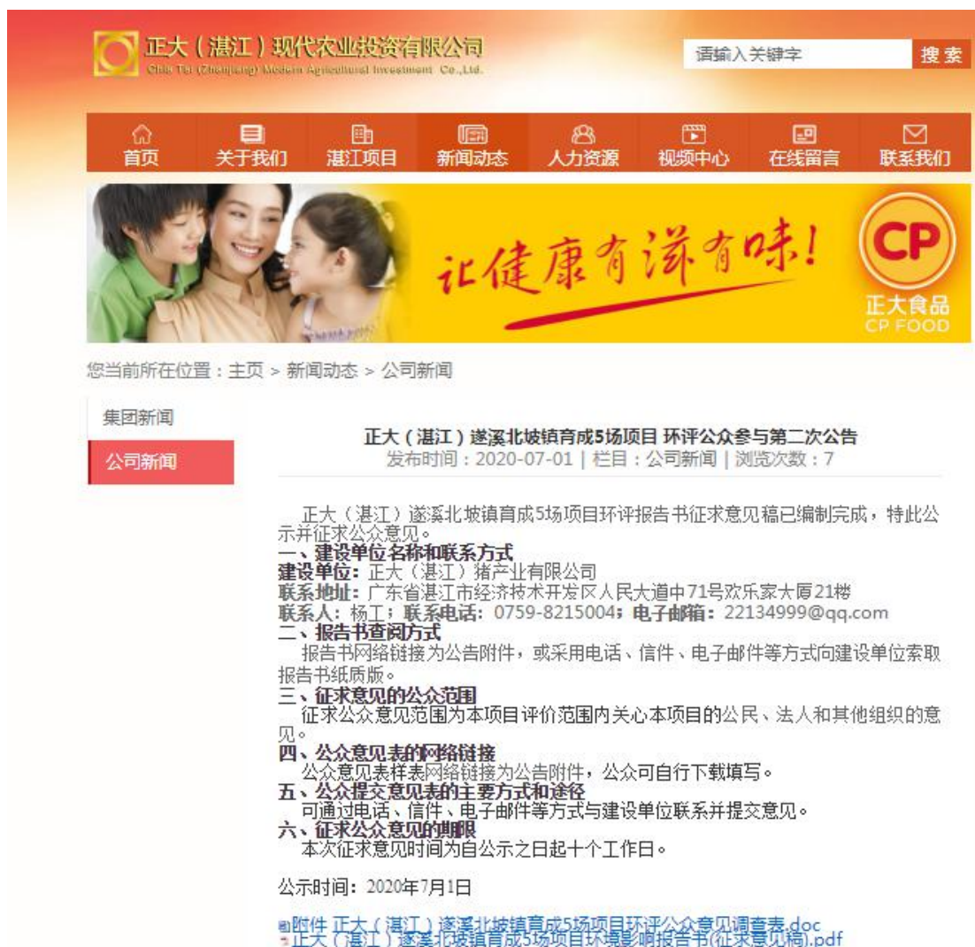
图 2 正大公司网站第二次公示截图