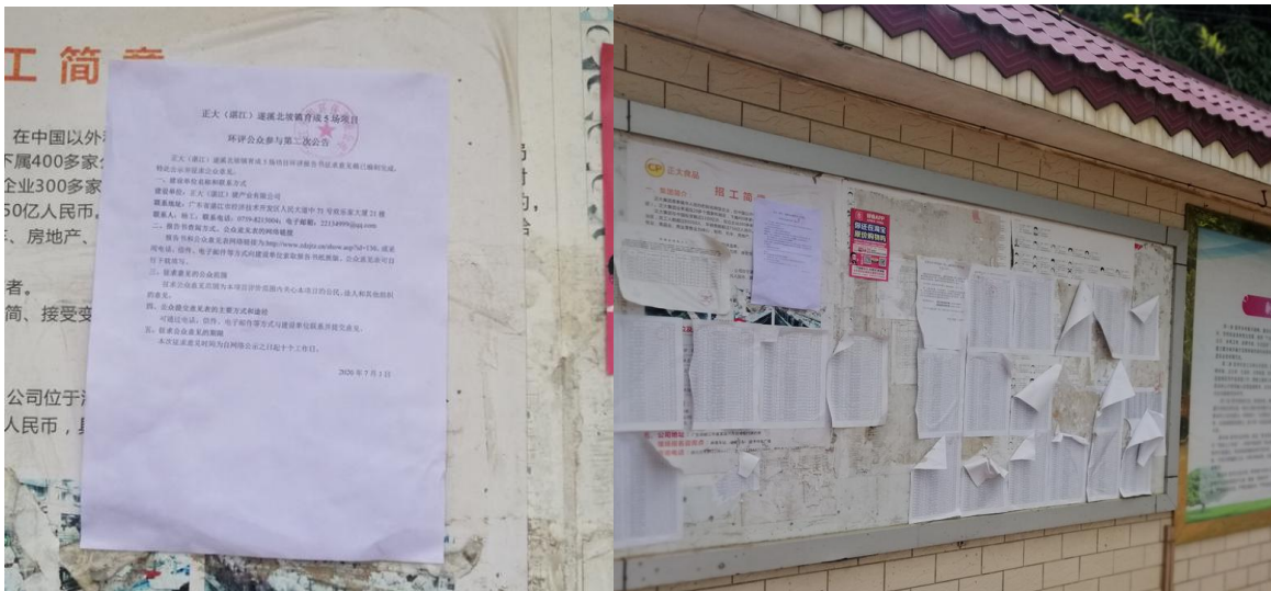
图 4 港门镇政府公示照片