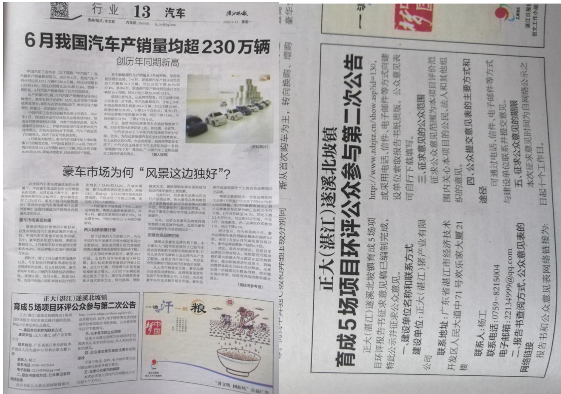
图6 7月13日湛江晚报登报公示照片