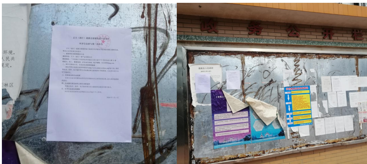
图 3 北坡镇政府公示照片