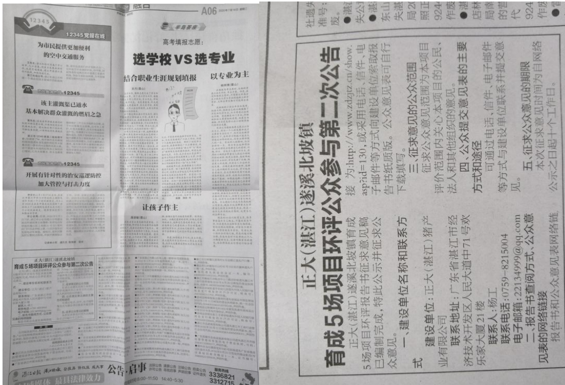
图7 7月14日湛江日报登报公示照片