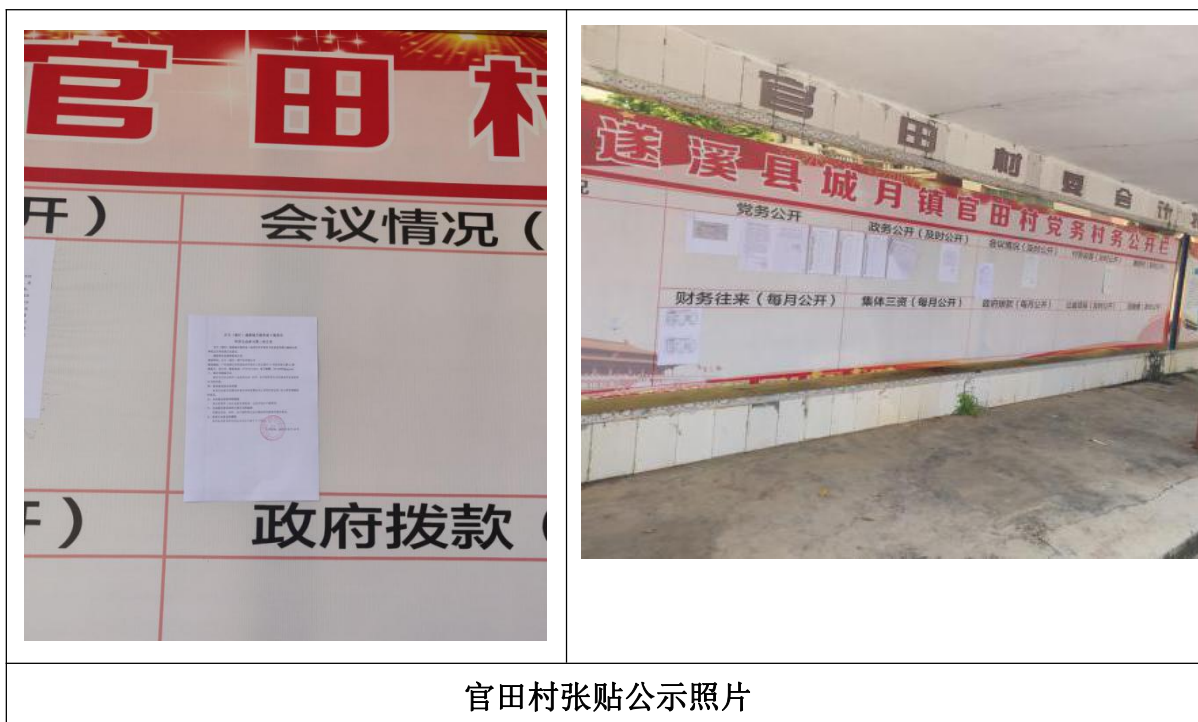
官田村张贴公示照片