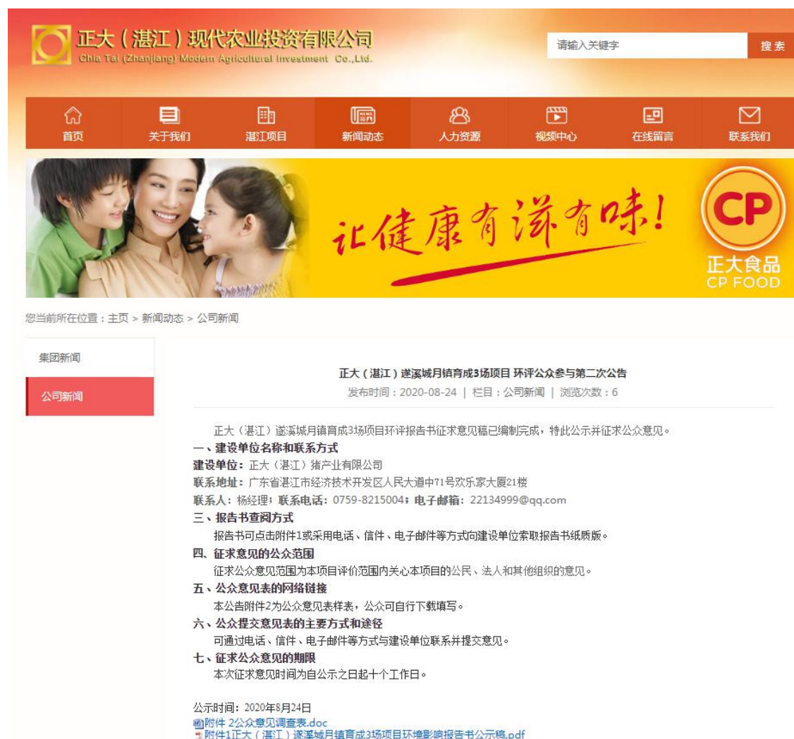
图 2 征求意见稿公示截图

参与办法》的要求。网络公示时间为2020年8月24日至2020年9月4日共10个工作日，网址为 http://zdzjtz.cn/news/gsxw/140.html ，截图见下图2。