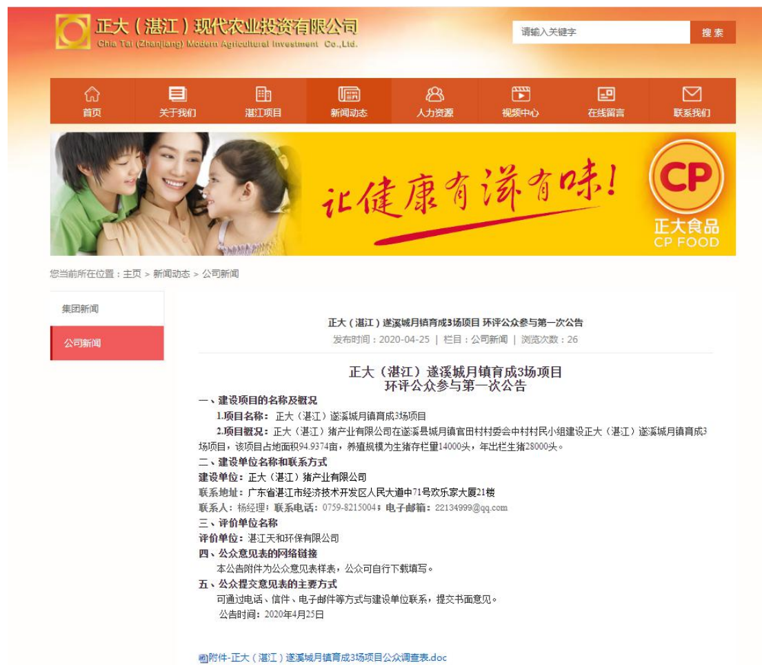
图1 首次网络公示截图

现代农业投资有限公司网站为建设单位网站，符合《环境影响评价公众参与办法》的要求。网络公示时间为2020年4月25日，网址为 http://zdzjtz.cn/news/gsxw/122.html ，截图见下图1。