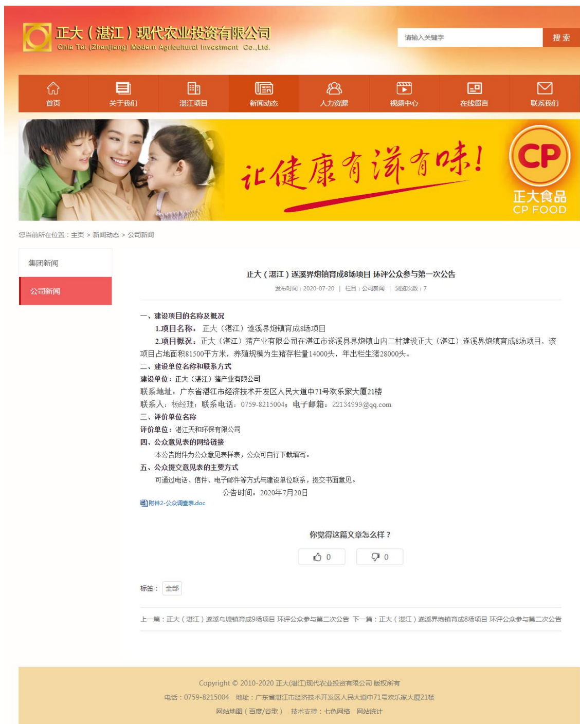
图 1 首次网络公示截图