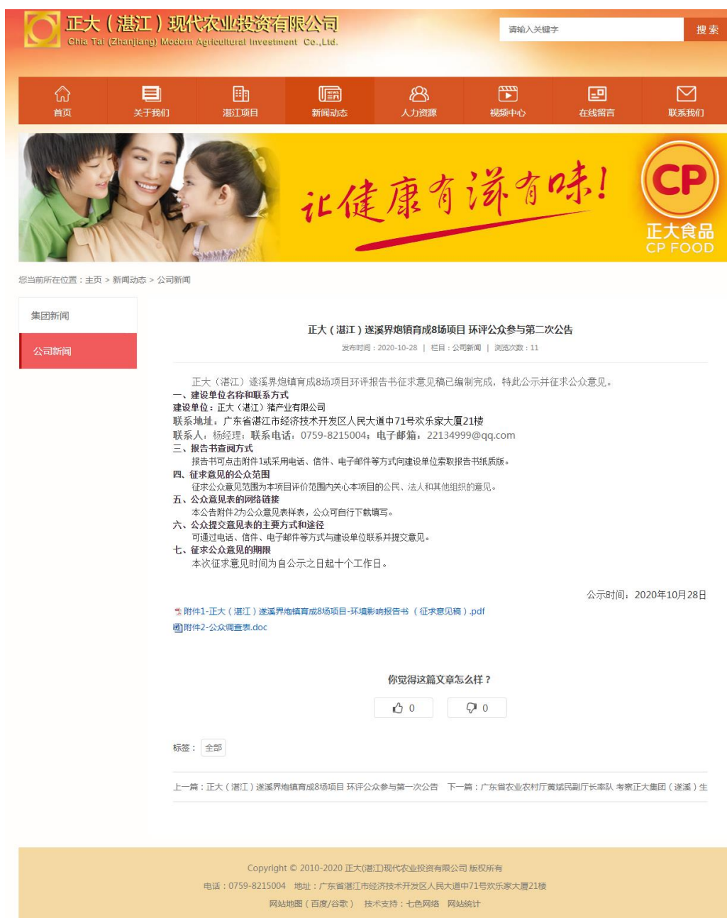
图2 征求意见稿公示截图

正大（湛江）遂溪界炮镇育成8场项目环境影响报告书征求意见稿网络公示通过正大（湛江）猪产业有限公司官方网站公开征求意见，正大（湛江）猪产业有限公司官方网站为建设项目所在地相关政府网站，符合《环境影响评价公众参与办法》的要求。网络公示时间为2020年10月28日至2020年11月10日共10个工作日，网址为 http://www.zdjtz.cn/news/gsxw/149.html ，截图见下图2。