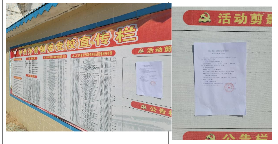
洋清镇张贴公示照片