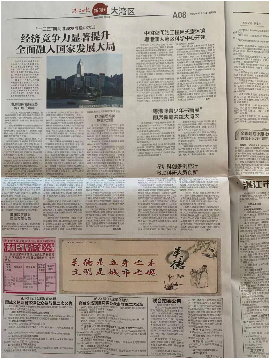
图3 湛江日报 2020年11月5日公示照片

正大(湛江)遂溪界炮镇育成8场项目环境影响评价报告书征求意见稿报纸公示通过湛江日报公开征求意见,湛江日报为建设项目所在地公众易于接触的报纸,符合《环境影响评价公众参与办法》的要求。报纸名称为湛江日报,公示时间为2020年11月5日、2020年11月6日,连续登报2次,报纸公示照片见下图3-4图4。