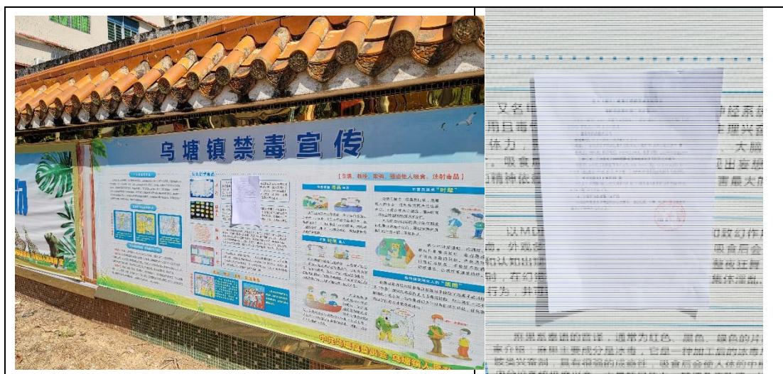
乌塘镇政府张贴公示照片

正大（湛江）遂溪乌塘镇育成 9 场项目环境影响报告书征求意见稿形成后，正大（湛江）猪产业有限公司通过在建设项目所在地周边的城月镇政府、城月镇扶良村委等居民点均为建设项目所在地公众易于知悉的场所，符合《环境影响评价公众参与办法》的要求。张贴公示时间为 2020 年 10 月 28 至 2020 年 11 月 11 日共 10 个工作日，地点为乌塘镇政府、杨柑镇政府、北坡镇政府，张贴公示照片见下图。