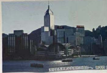
粤港澳大湾区的快速发展，成为国家发展大局的重要组成部分。

今年是全面建成小康社会收官之年、“十三五”规划收官之年。五年间，香港和澳门相继完成“十三五”规划的主要任务，进一步发挥了在国家发展大局和对国际经济中的独特作用。