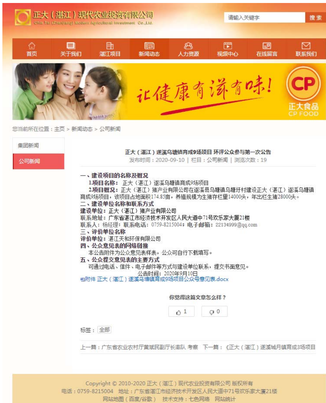
图 1 首次网络公示截图