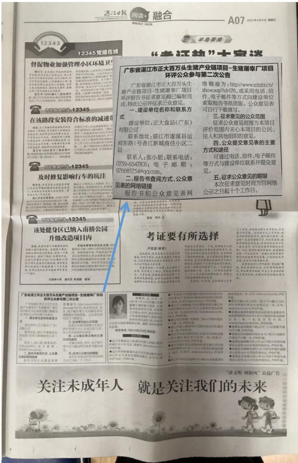
图3 4月5日湛江日报登报公示照片

广东省湛江市正大百万头生猪产业链项目-生猪屠宰厂项目环评公众参与第二次公告 广东省湛江市正大百万头生猪产业链项目-生猪屠宰厂项目环评报告书征求意见稿已编制完成,特此公示并征求公众意见。 一、建设单位名称和联系方式 建设单位:正大食品(广东)有限公司 联系地址:湛江市遂溪县运河东路1号香江新城商住小区二层 联系人:张小姐;联系电话:0759-6547831;电子邮箱:976685754@qq.com。 二、报告书查阅方式、公众意见表的网络链接 报告书的网络链接: http://www.zdjtzt.cn/show.asp?id=176 。或采用电话、信件、电子邮件等方式向建设单位索取报告书纸质版。公众意见表可自行下载填写。 三、征求意见的公众范围 征求公众意见范围为本项目评价范围内关心本项目的公民、法人和其他组织的意见。 四、公众提交意见表的主要方式和途径 可通过电话、信件、电子邮件等方式与建设单位联系并提交意见。 五、征求公众意见的期限 本次征求意见时间为自网络公示之日起十个工作日。