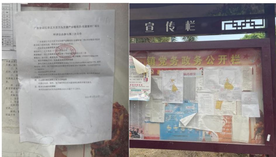
图6 客路镇政府公示照片