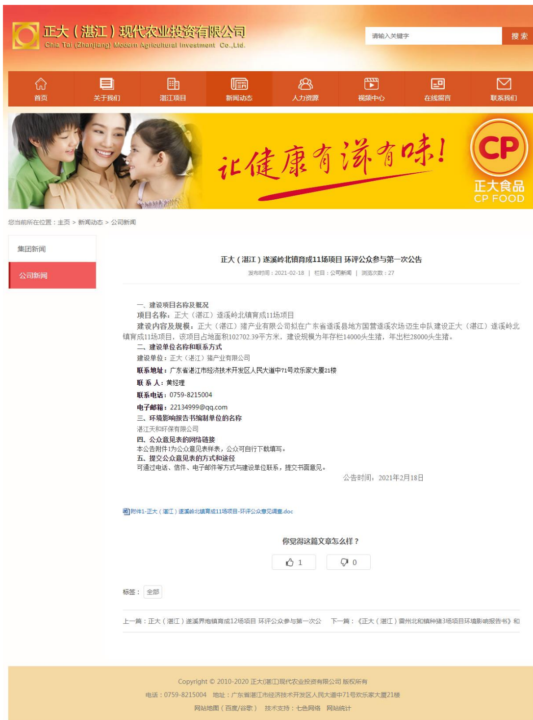
图 1 首次网络公示截图