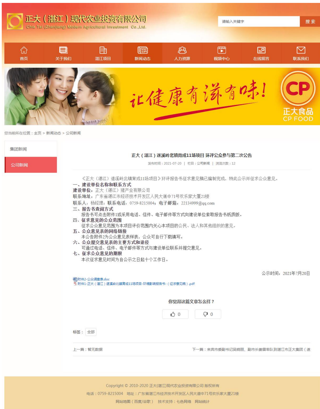
图 2 征求意见稿公示截图