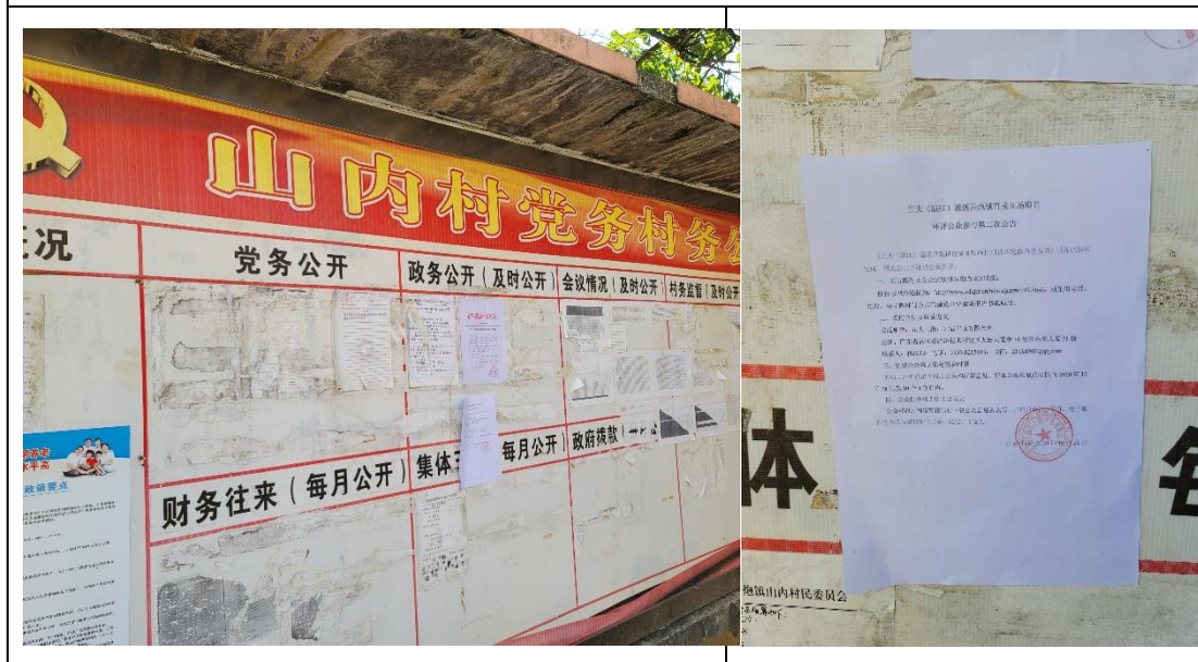
麻章高阳队委粘贴公示照片