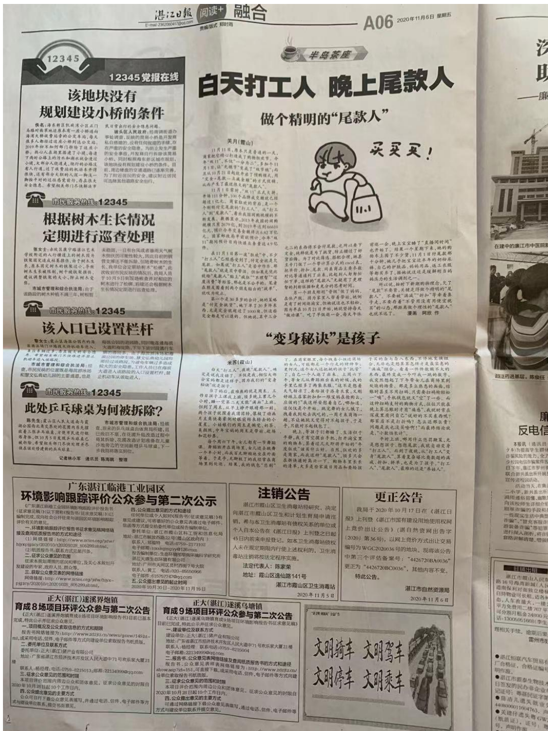
图4 湛江日报 2021年8月1日公示照片